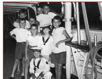
Les petits mousses de la marine italienne à bord du Belem.

Témoignage de Giovanni Alliata di Montereale, petit-fils du Comte Vittorio Cini