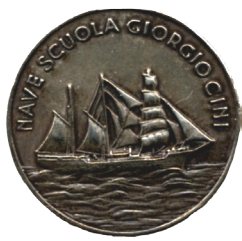
médaillon du navire-école Giorgio Cini

Des centaines d'anciens marinaretto du Giorgio Cini qui ont été formés à son bord, conservent avec émotion des souvenirs encore vivaces aujourd'hui. Ils seront présents pour accueillir le retour de leur « Giorgetta ». Certains d'entre eux embarqueront pour revivre l'aventure de leur jeunesse et être à bord lors de l'arrivée à Venise.