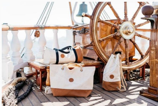
VIDEO 727 Sailbags