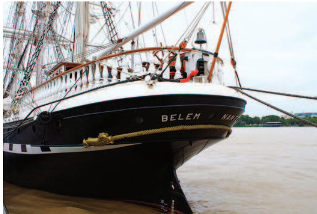
Poupe du Belem