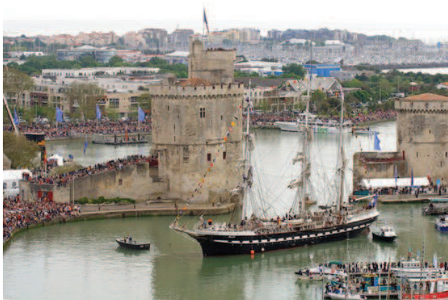
Le Belem dans le port de La Rochelle

Ce navire école est ouvert à tous et offre des séjours d'initiation pour découvrir la navigation à bord d'un légendaire voilier du 19 ème siècle.