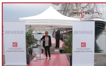
Habillage du Belem à vos couleurs